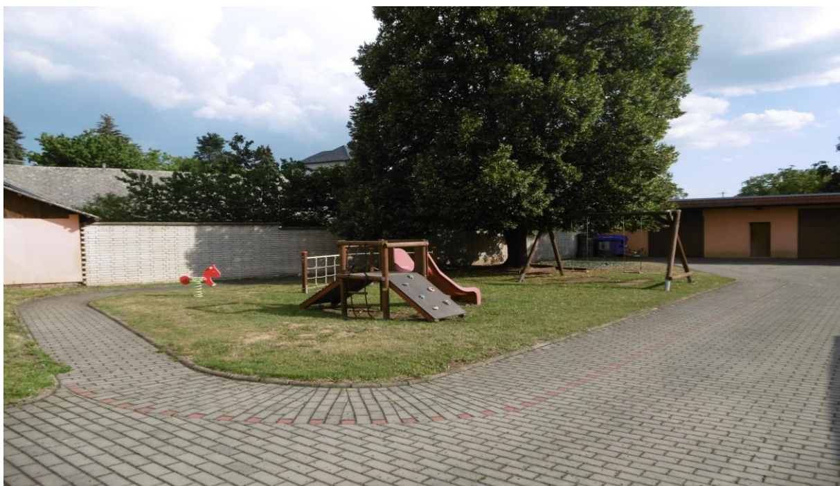
Obr. 5 Houpačky u fotbalového hřiště