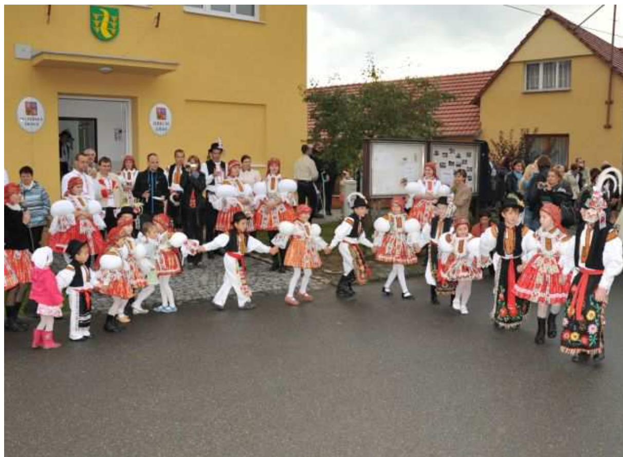
Vystoupení dětí na Hody 2013