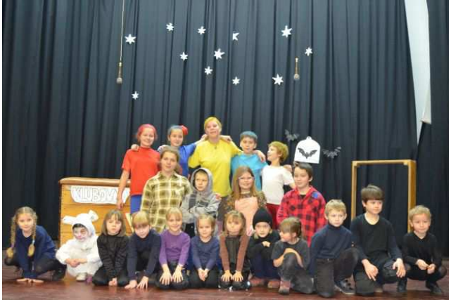
Představení Rychlé šípy

V zimě jsme kromě obvyklých věcí, jako strojení stromečku zvířátkům, roznášení betlémského světla , hráli po dlouhé době na druhý svátek vánoční divadlo. Děti podaly úžasný herecký výkon i přes počáteční nervozitu.