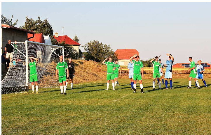
Momentka z vyhecovaného derby.