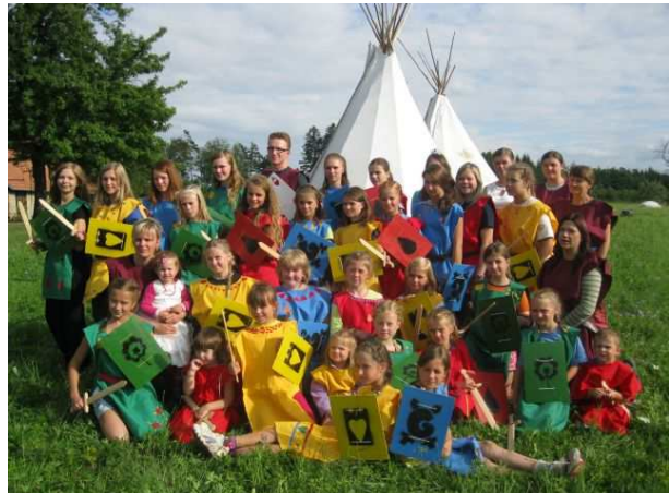
Naše letní tábory a výpravy