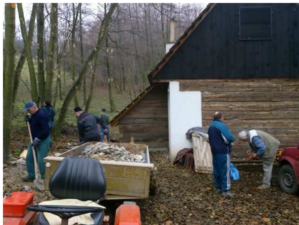
Brigáda OÚ na srubu