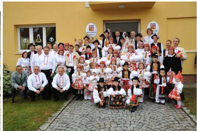
Hody se letos nakonec přece jen povedly