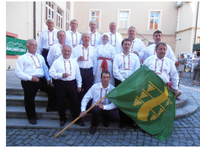
Na slavnostech vína

To o co nám v první řadě jde, tedy o zpěv, je také tím, co nás nejvíc zaměstnává – ať se už je to vánoční zpívání (letos třeba i v Medlovicích) nebo kosecké zpívání v Loučkách. Když se snoubí zpívání s vinařskými tradicemi, je to o třídu lepší zážitek i pro nás. Letos to byly například Zarážení hory, otevírání Svatomartinských vín, Žehnání vína nebo tradiční košty (letos i košt slivovice v Tučapech). Událostí, na kterou se obzvláště těšíme jsou samozřejmě tradiční hody, jež jsou pro nás tou snad nejdůležitější událostí v roce. I přesto, že jsme se na letošní hody připravovali velmi zodpovědně, dovolily jsme si malou přestávku v předhodovém kvapíku – a to Slavnosti vína v Uherském Hradišti. I přes masovost této akce se nám na slavnostech moc líbilo a snad jsme ani naší obci neudělali ostudu.