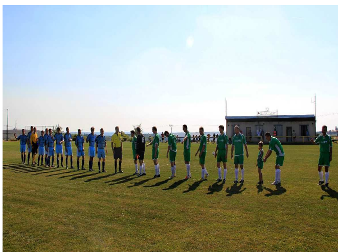
Napjaté chvíle před utkáním obou rivalů