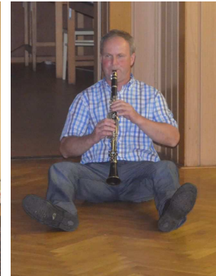
...i hrály „hojačky“

Zvláštními událostmi tohoto roku se pro naše seskupení staly oslavy. Ne, že by v loňském roce žádné nebyly, ale letos se jich zkrátka „urodilo“. Aneb jak řekl jeden z nás „chlapi toto sdružení vzniklo v pravou chvíli“. Svě kulatiny oslavili hned 4 chlapi. A že oslavy stáli za to, si můžete být jisti.