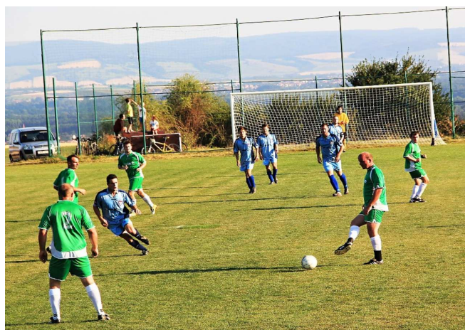
Utkání bylo vrcholem podzimu.