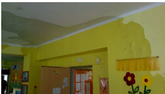
Nepříjemná událost – havárie vody v budově OÚ