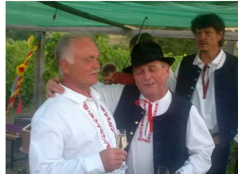
Fotografiemi se vracíme do parného srpna na zarážení hory v Polešovicích