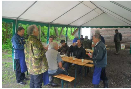
Kosecké v Loučkách