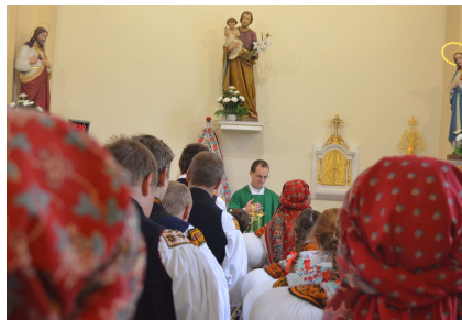
Hodová mše svatá