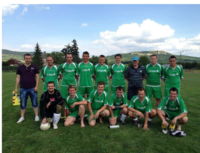
V létě jsme se zúčastnili turnaje v Dolních Dunajovicích.