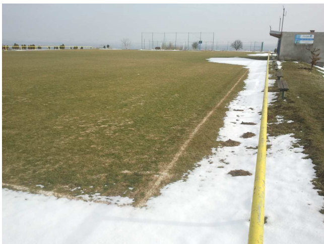
Takto vypadalo hřiště ještě na začátku dubna.

Tradiční zakončení podzimní sezóny s vyhodnocením podzimu se tentokrát uskutečnilo ve vážanské hospodě v sobotu dne 2.11.2013. Zahráli jsme si bowling, povečeřeli jsme, probrali jak uplynulou, tak nadcházející fotbalovou sezónu, připili si na úspěch v dalších utkáních, a když bylo málo hodin, tak jsme se spokojeně rozešli.