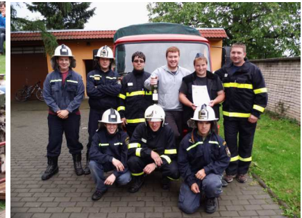
Snímky z Okrskové soutěže a oslav založení sboru v Kostelanech a Polešovicích