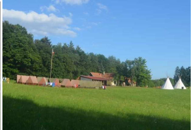
Naše táborové útočiště