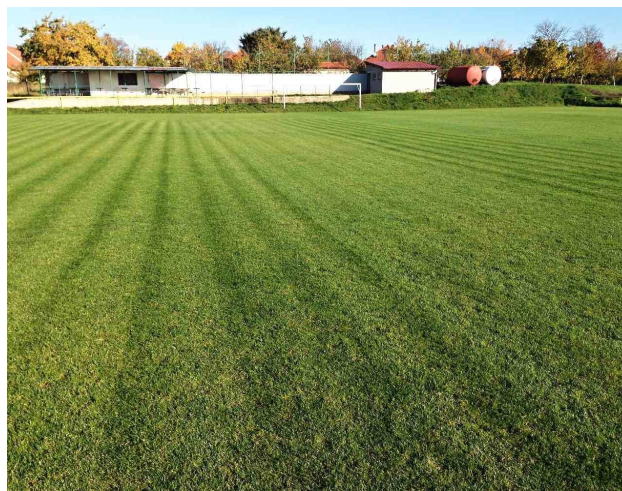
A takto v říjnu na konci podzimní části.