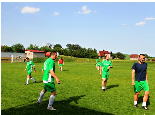
Vážanské opory před utkáním proti Ostrožské. Nové Vsi B.