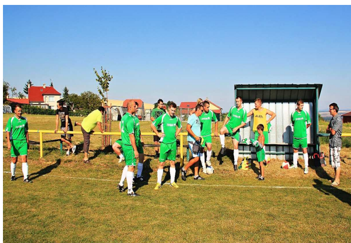
Nejočekávanější utkání za několik let – derby s Polešovicemi.