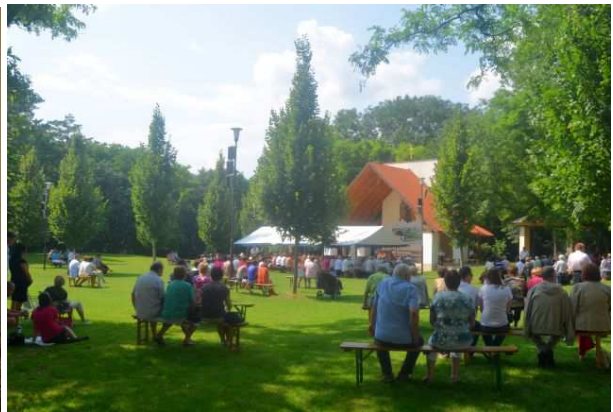
Na hoře sv. Antonína