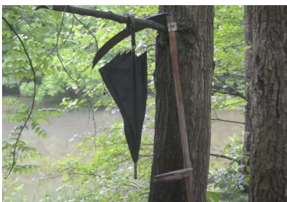
Symbyly letošního ročníku Kosení v Loučkách