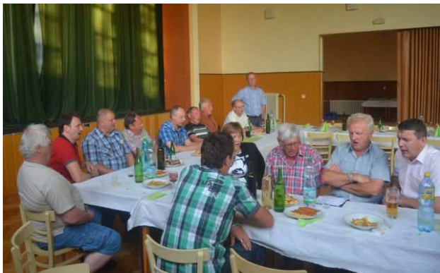
Při oslavách se zpívalo...

To o co nám v první řadě jde, tedy o zpěv, je také tím, co nás nejvíc zaměstnává – ať se už je to vánoční zpívání (letos třeba i v Medlovicích) nebo kosecké zpívání v Loučkách. Když se snoubí zpívání s vinařskými tradicemi, je to o třídu lepší zážitek i pro nás. Letos to byly například Zarážení hory, otevírání Svatomartinských vín, Žehnání vína nebo tradiční košty (letos i košt slivovice v Tučapech). Událostí, na kterou se obzvláště těšíme jsou samozřejmě tradiční hody, jež jsou pro nás tou snad nejdůležitější událostí v roce. I přesto, že jsme se na letošní hody připravovali velmi zodpovědně, dovolily jsme si malou přestávku v předhodovém kvapíku – a to Slavnosti vína v Uherském Hradišti. I přes masovost této akce se nám na slavnostech moc líbilo a snad jsme ani naší obci neudělali ostudu.