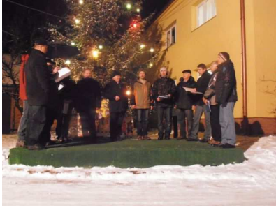
Zpívání u stromečku

Milí příznivci zpěvu, vína a tradic Slovácka, moc rádi se s vámi po roce opět setkáváme na stránkách obecního zpravodaje, a tak bychom se s vámi rádi podělili o naše radosti z uplynulého roku.