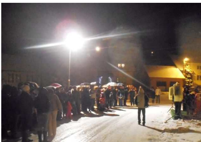
Zpívání u vánočního stromu